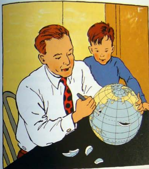
看起來就像萬聖節的南瓜燈一樣，但切割的對象換成了地球，切割下來的是塊塊版圖，繪圖者想藉此諷諷美國人切割地球為已有的老大心態；豈待等兒下刀都可以。

相較於米丹對美國政府的批判，費雪的「切割地球儀的人」則更進一步批判人們在最不自覺的狀況下所傳遞的文化意識形態，簡單溫馨的人間景象中，所進行的卻可能是對世界上其他存在者的傷害。費雪的這種反省與批判，不分你我且非常嚴厲。